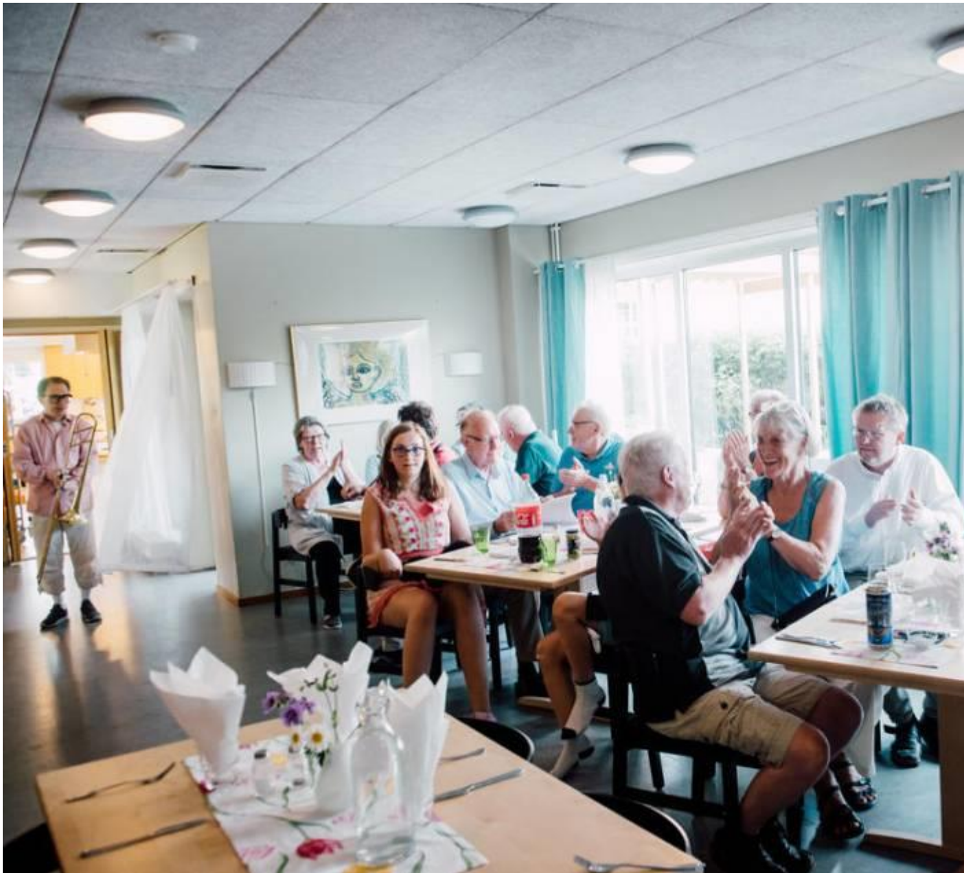
Festligt. Kvällens middag inleds med en livs levande trumpetfanfar.