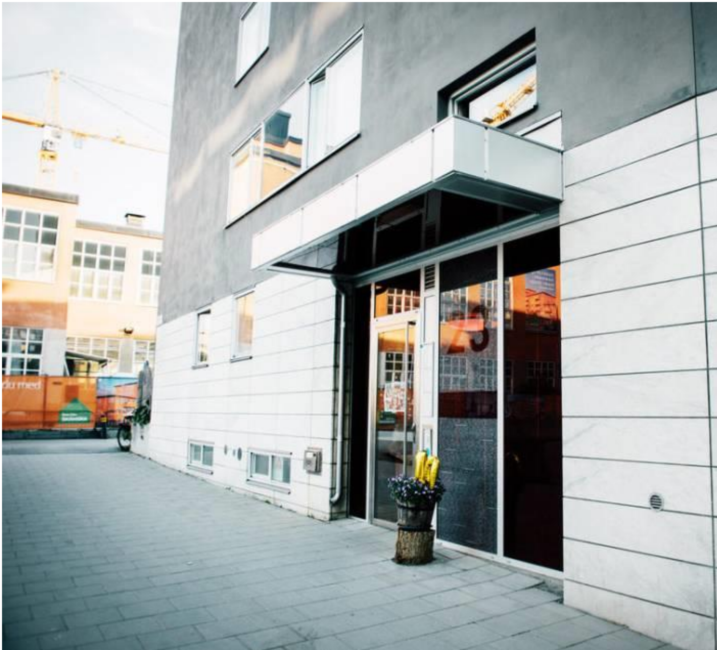
ENTRÉ. Bakom den här dörren på Heliosgatan döljer sig Hammarby Sjöstads enda kollektivhus: Sjöfarten.